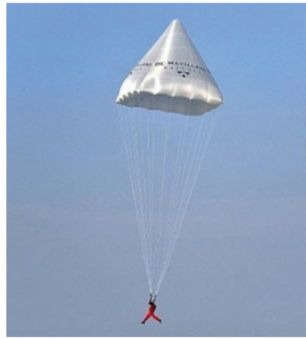
მასალა მოამზადა მანანა მიქელაძემ

ხუთასი წლის წინ შვეიცარიელი ოლივერ ვიეტიტემა ლეონარდო და ვინჩის მიერ შექმნილი პარაშუტი გადმოხტა. პარაშუტის მოდელი ოთხი სამკუთხედიანა შექმნილი, რომელიც მთლიანობაში პირამიდისაა ქმნის. მისი კონსტრუქცია 1485 წლით დათარიღებულ ერთერთ ტექსტშია აღწერილი. შვეიცარიელი პირველი აღმოჩნდა, ვინც კონსტრუქცია წარმატებით გამოსცადა. 2000 წელს ამ ექსპერიმენტის გამეორება ინგლისელმა ედრიან ნიკოლსმაც სცადა, მაგრამ იძულებული გახდა ჩვეულებრივი პარაშუტით დაშვებულიყო.