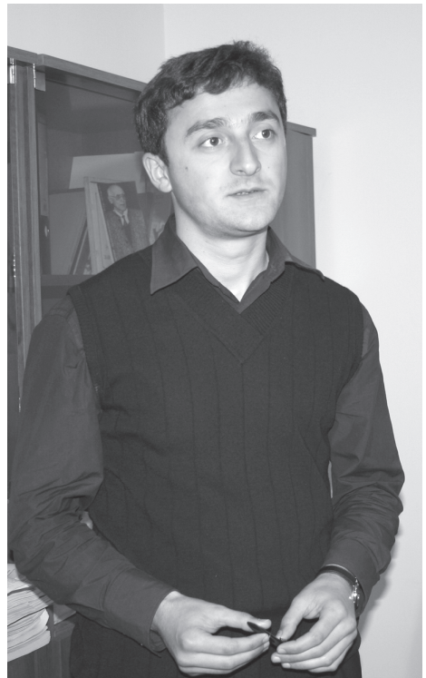
სპორტის განყოფილება, ტურიზმის განყოფილება, სტუდენტთა უფლებების დაცვის განყოფილება... ანუ, ძირითადად, ფაკულტეტები ამუშავდებიან. ვაუქმებთ საგარეო ურთიერთობათა დეპარტამენტს.

— ამჯერად სტუდენტური თვითმმართველობის დეცენტრალიზებულ სტრუქტურის დამტკიცების შემდეგ შეუდგება. დებულება უნდა დაამტკიცოს საერთო კრებამ ხმათა ორი მესამედით. მასში განვიხილავთ იქნება თვითმმართველობის სტრუქტურა, რომელსაც მოვარგებთ ადამიანურ რესურსს. სიახლე გახლავთ ის, რომ ახალი თვითმმართველობა დეცენტრალიზებული სტრუქტურად ყალიბდება. ბიუჯეტი ფაქტობრივად პროპორციულად გადანაწილდება. გამოწვევის შეიძლება იყოს მედიცინის ფაკულტეტი, რომელსაც ოდნავ ნაკლები ბიუჯეტი შეიძლება ჰქონდეს, რადგან ამ ფაკულტეტზე მხოლოდ 800 სტუდენტი სწავლობს. შეიქმნება დეპარტამენტები, რომლებიც თვითმმართველობის ფუნქციონირებას ყველა მმართველობით შეუწყობენ ხელს. სიახლე ისიც, რომ ფაკულტეტზე იქნება განყოფილებები, ვთქვათ, კულტურის განყოფილება,